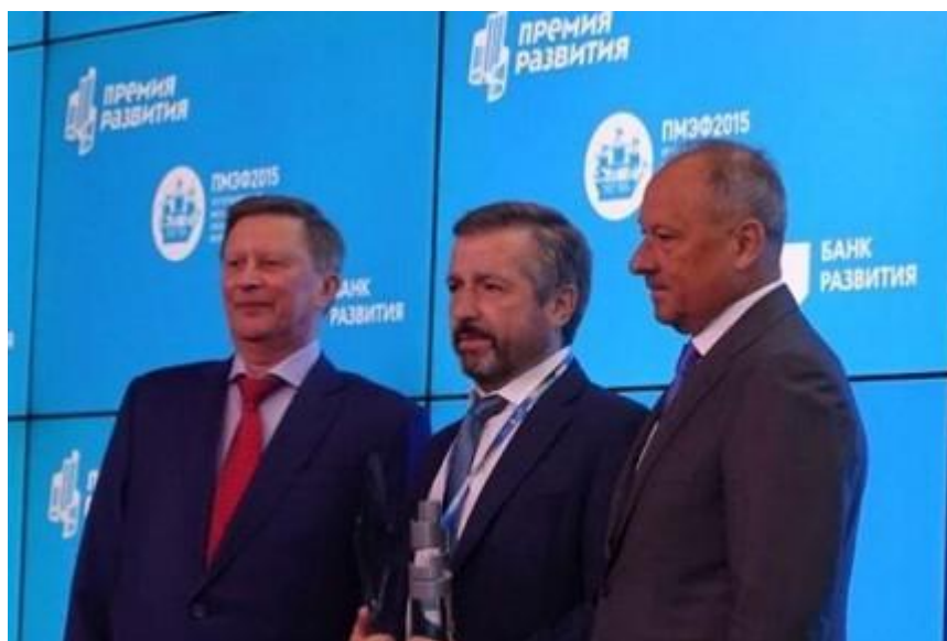
УТЗ наградили за лучший экспортный проект

Реализованный в Монголии. 19 июня 2015 года в рамках Петербургского международного экономического форума состоялась церемония вручения ежегодной "Премии развития". Она учреждена Внешэкономбанком и дается за реализацию национально значимых инвестпроектов. ЗАО "Уральский турбинный завод" (холдинг РОТЕК) стало победителем в номинации "Лучший экспортный проект" - предприятие отметили за строительство для Улан-Баторской ТЭЦ-4 нового энергоблока мощностью 123 МВт.