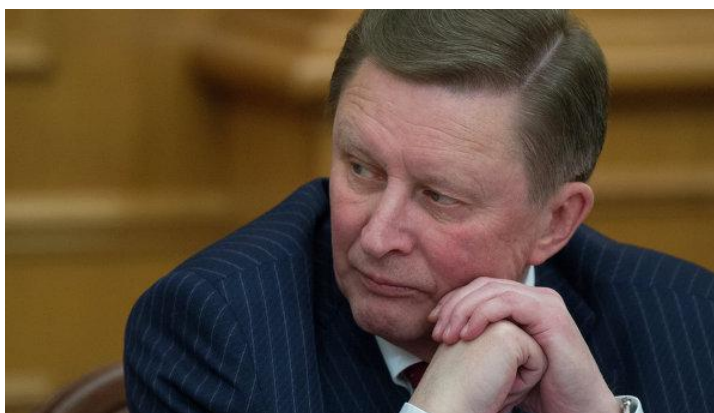
Руководитель администрации президента РФ Сергей Иванов. Архивное фото

Конкурс на присуждение премии за вклад в устойчивое социально-экономическое развитие России был учрежден Внешэкономбанком в 2012 году. Это профессиональная награда, присуждаемая юридическим и физическим лицам за заслуги в области реализации крупных национально значимых инвестпрограмм, внесших вклад в социально-экономическое развитие страны.